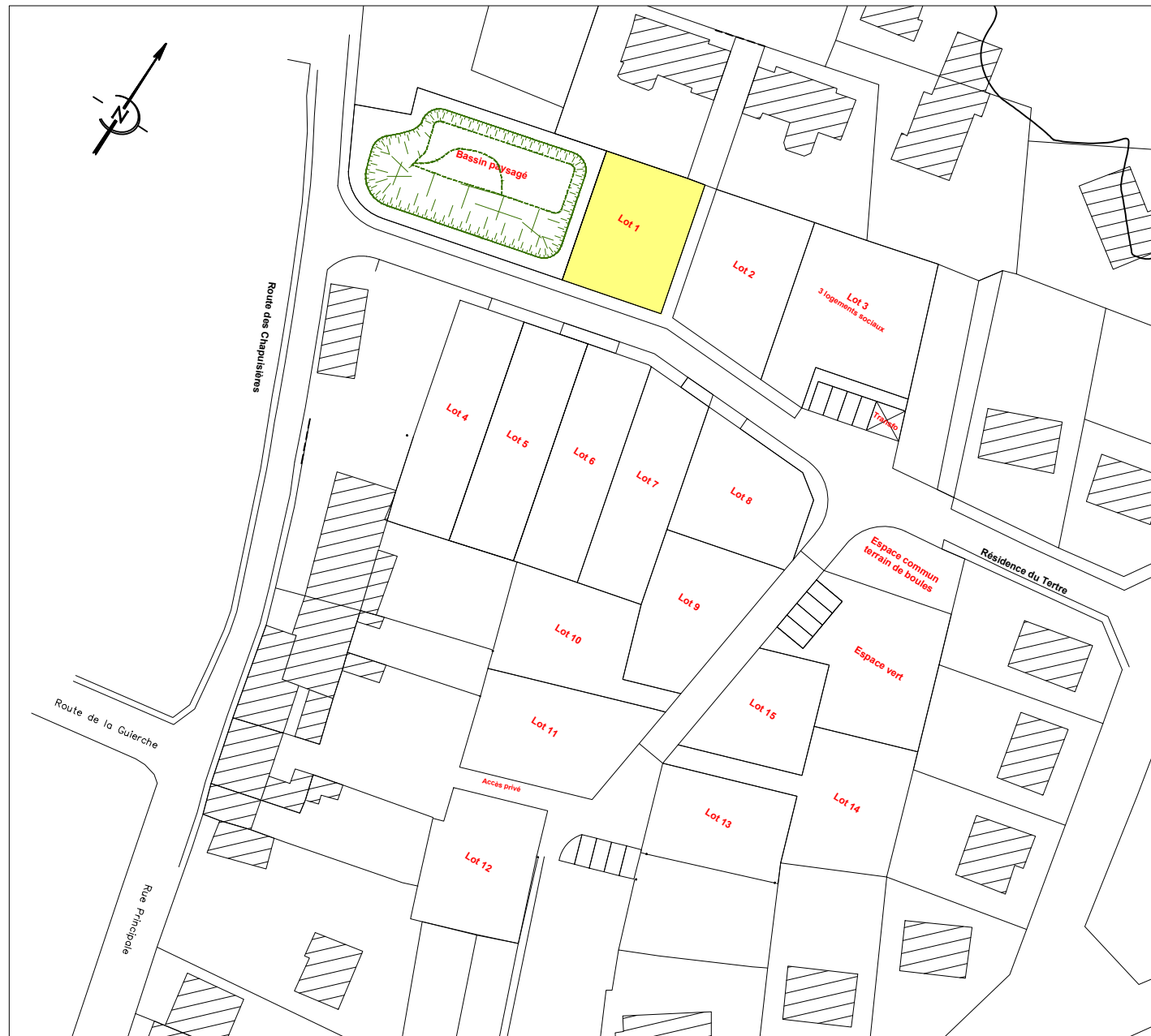
PLAN DE COMPOSITION Echelle 1/1000

Département de La SARTHE Commune de Joué l'Abbé Lotissement "La Chapuisière"