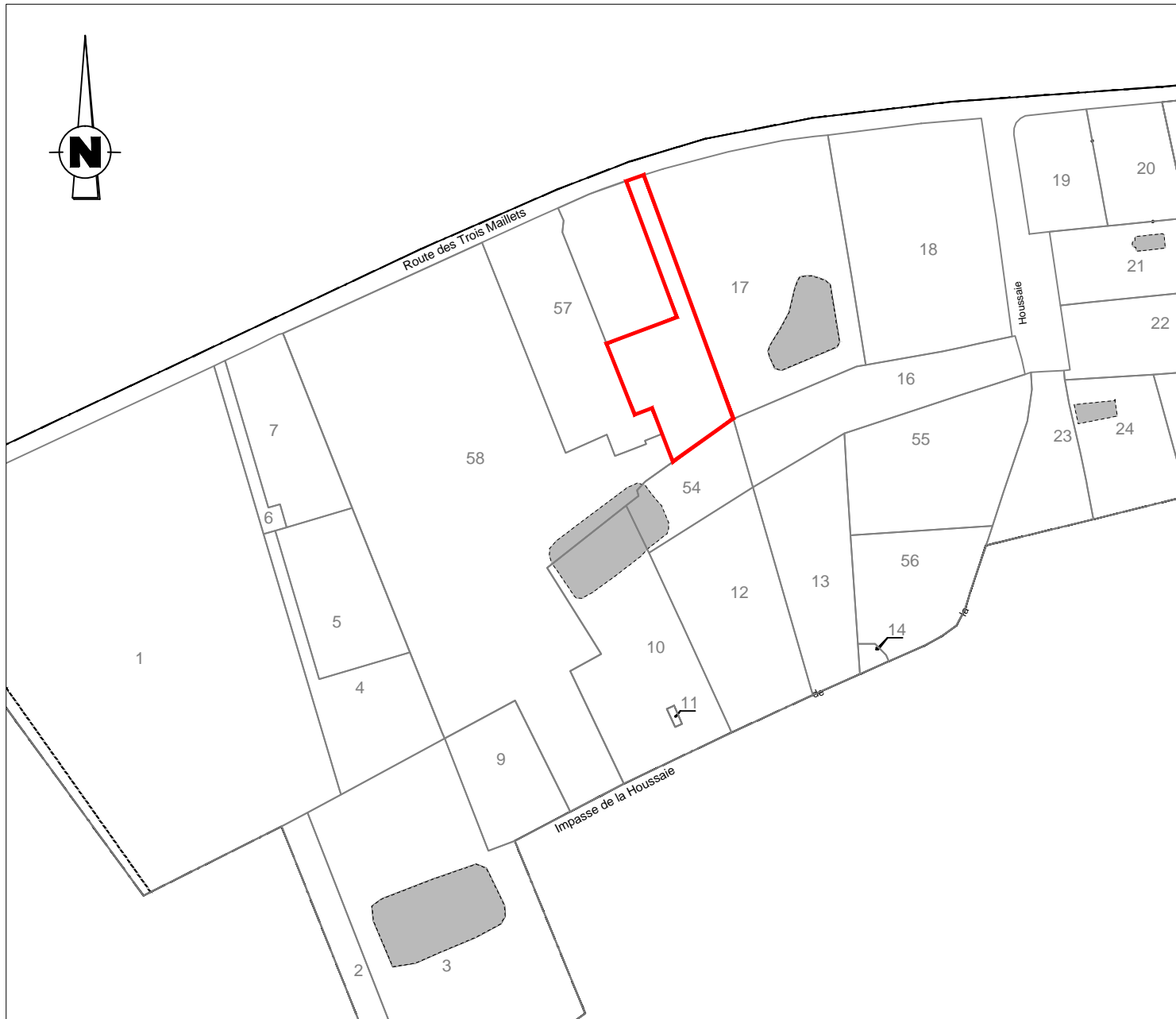
PLAN DE COMPOSITION Echelle 1/2000

Maitre d'Ouvrage : FONCIER AMENAGEMENT 3, Rue René Hatet - Appt n°002 72000 Le Mans Tél. 02.43.86.64.76