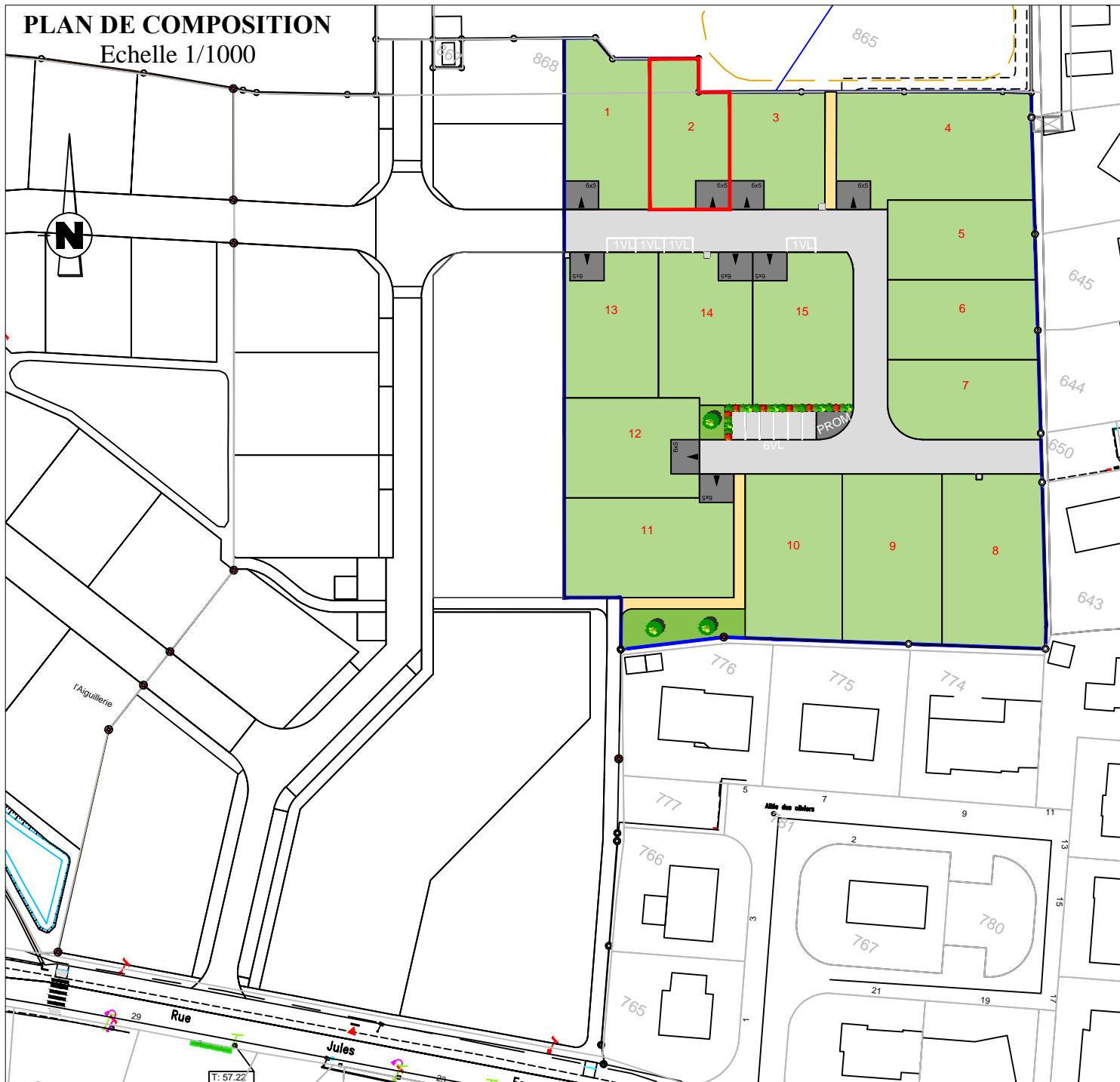
PLAN DE COMPOSITION Echelle 1/1000