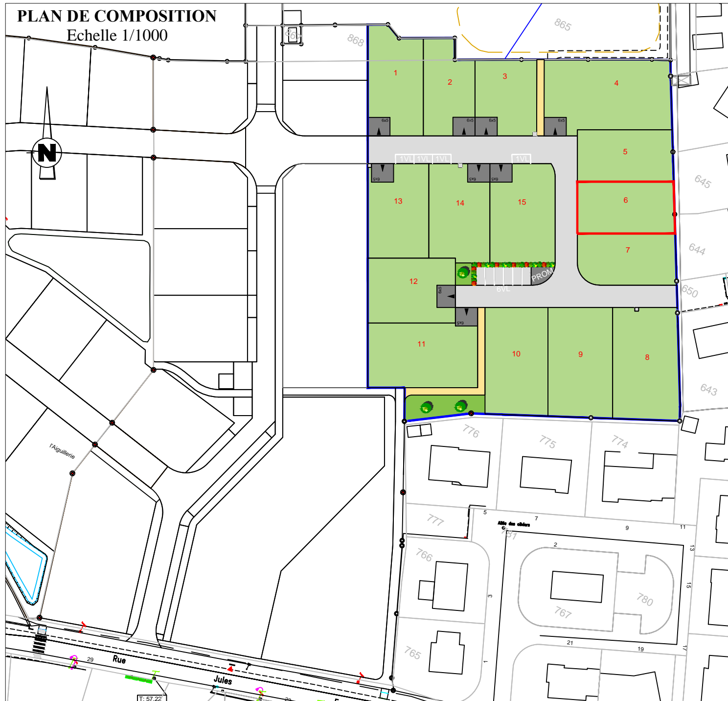
PLAN DE COMPOSITION Echelle 1/1000