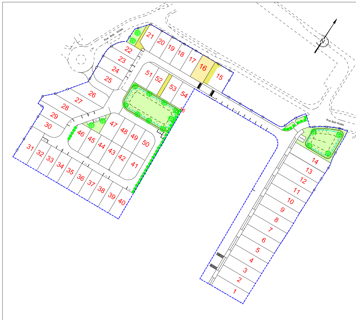
PLAN DE COMPOSITION Echelle 1/1250

Maitre d'Ouvrage : Foncier Aménagement 65, Avenue Georges Durand 72 100 LE MANS Tél. 06.32.99.25.32 Fax. 02.43.86.64.76 bgbd.aménagement@orange.fr