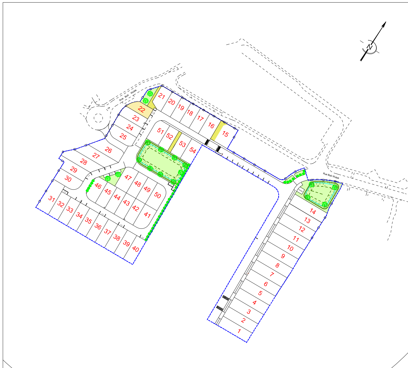
PLAN DE COMPOSITION Echelle 1/2000

Maitre d'Ouvrage : Foncier Aménagement 65, Avenue Georges Durand 72 100 LE MANS Tél. 06.32.99.25.32 Fax. 02.43.86.64.76 bgbd.aménagement@orange.fr