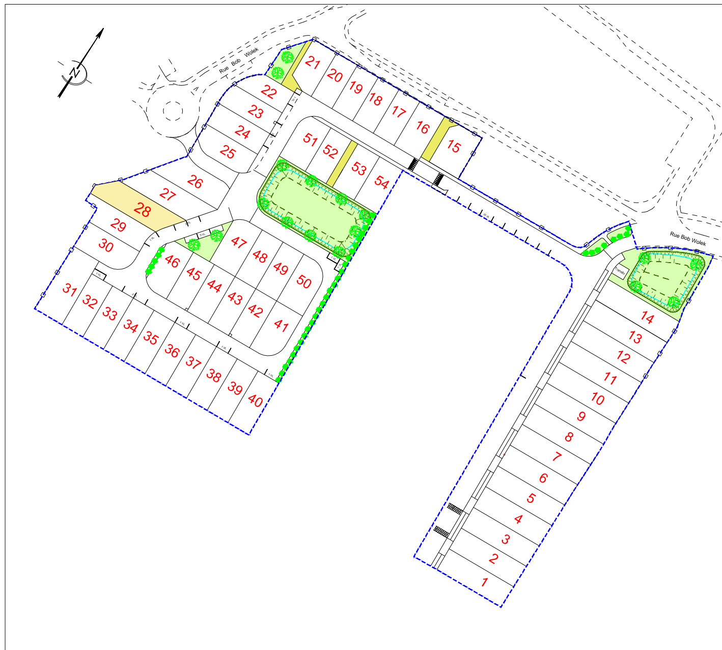
PLAN DE COMPOSITION Echelle 1/1250

Maitre d'Ouvrage : Foncier Aménagement 65, Avenue Georges Durand 72 100 LE MANS Tél. 06.32.99.25.32 Fax. 02.43.86.64.76 bgbd.aménagement@orange.fr