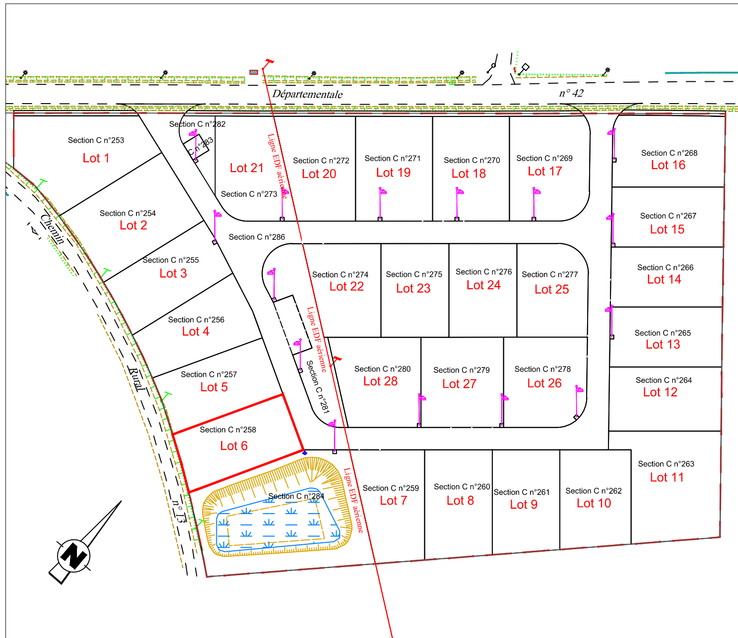
PLAN DE COMPOSITION Echelle 1/1000

Département de La SARTHE Commune de CORMES "Le Clos des Rosiers"