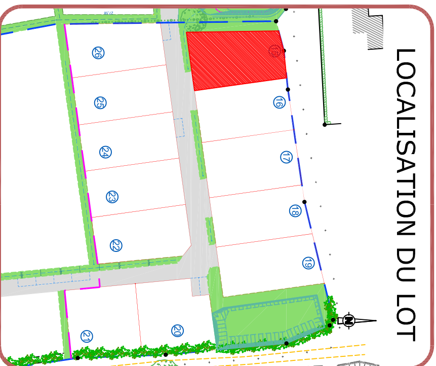
LOCALISATION DU LOT