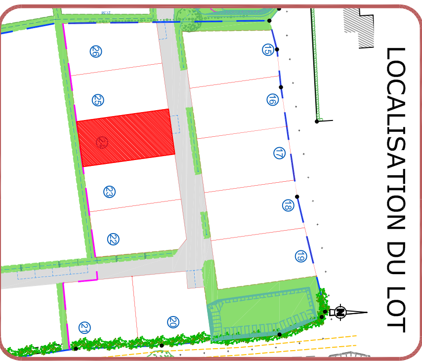
LOCALISATION DU LOT