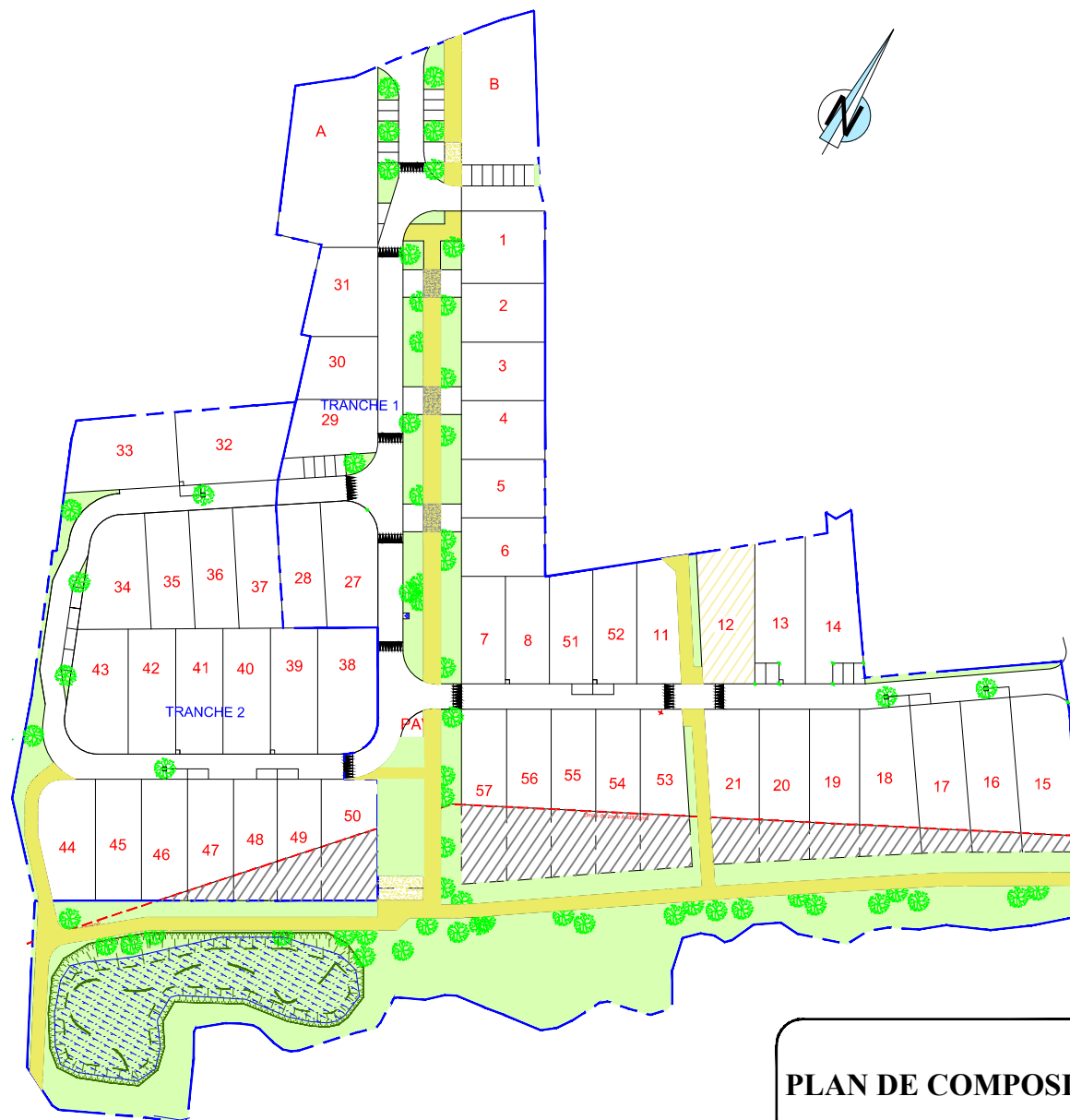
PLAN DE COMPOSITION

Maître d'Ouvrage : Foncier Aménagement 3, Rue René Hatet - Appt n°2 72 000 LE MANS Tél. 02.43.86.64.76 bgbd.aménagement@orange.fr