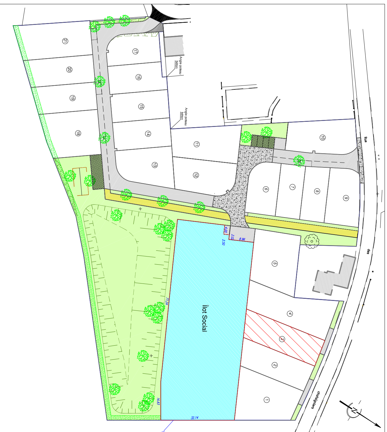
PLAN DE COMPOSITION Echelle 1/1000

Maitre d'Ouvrage : Foncier Aménagement 65, Avenue Georges Durand 72 100 LE MANS Tél. 06.32.99.25.32 Fax : 02.43.86.64.76 bgbd.aménagement@orange.fr