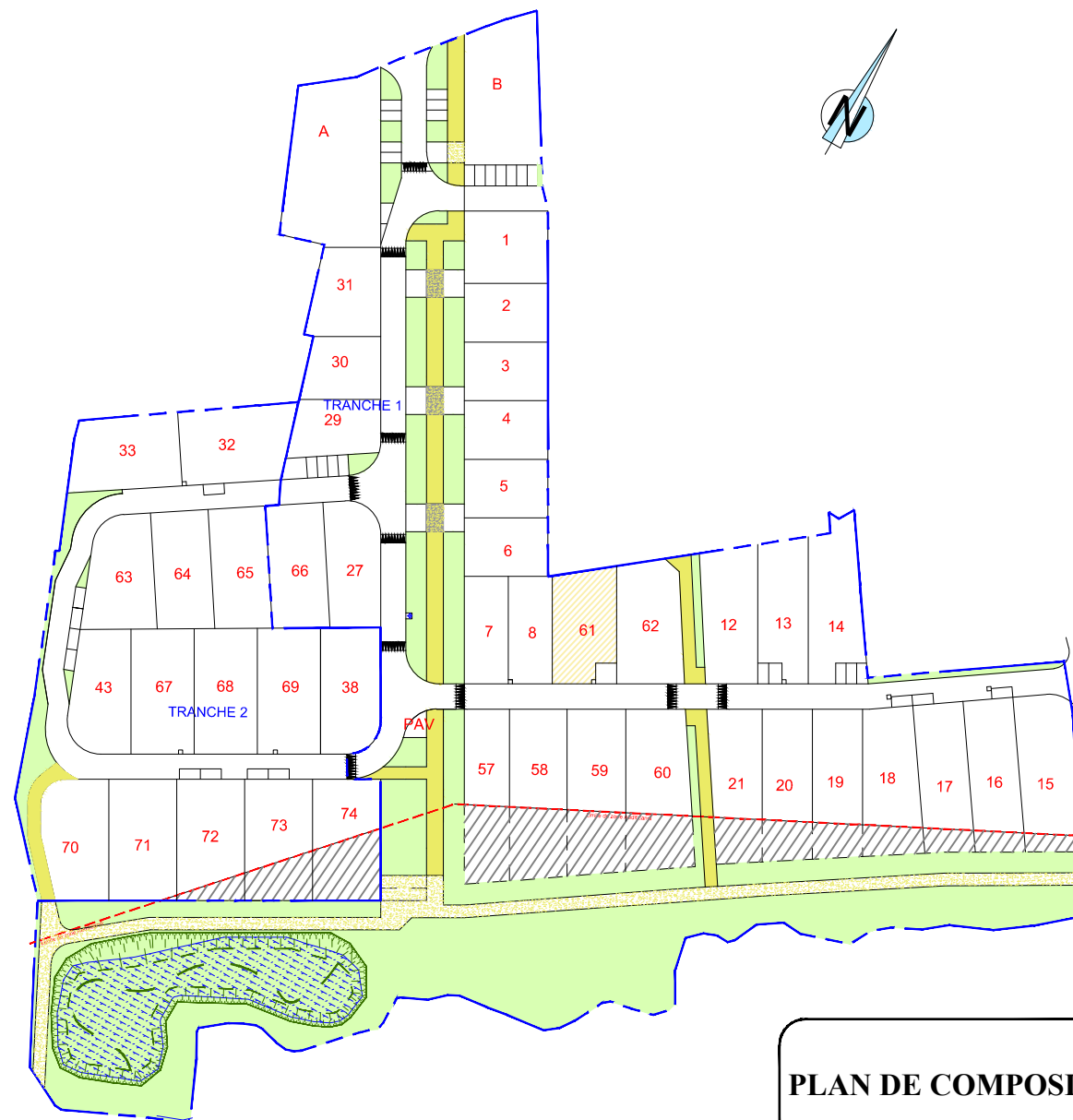
PLAN DE COMPOSITION

Maître d'Ouvrage : Foncier Aménagement 3, Rue René Hatet - Appt n°2 72 000 LE MANS Tél. 02.43.86.64.76 bgbd.aménagement@orange.fr