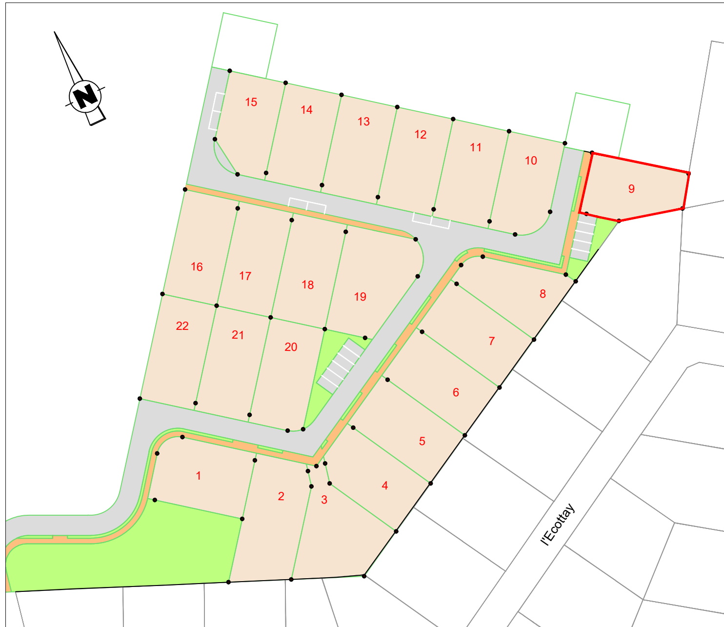
PLAN DE COMPOSITION Echelle 1/1000

Maitre d'Ouvrage : FONCIER AMÉNAGEMENT 3, Rue René Hatet - Appt n°002 72000 Le Mans Tél. 02.43.86.64.76