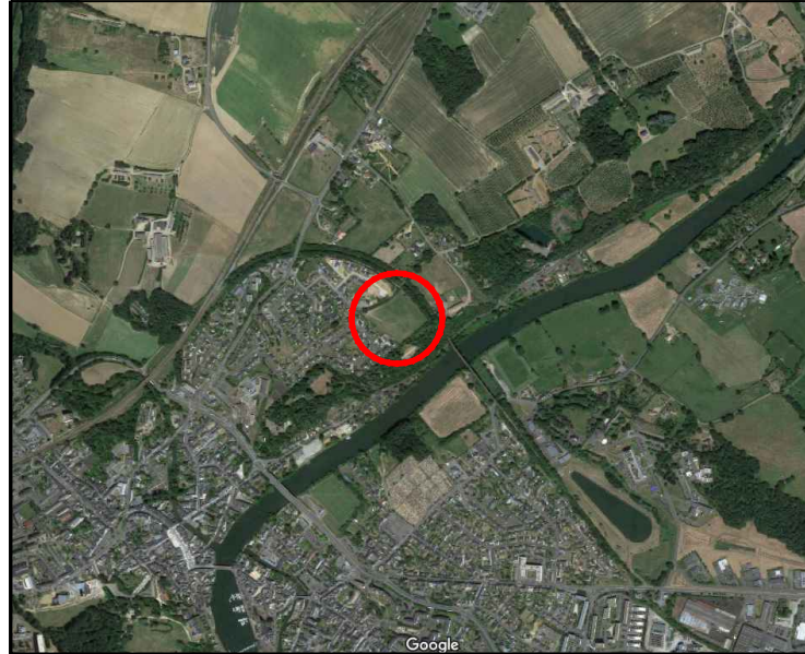
PLAN D'ENSEMBLE - Sans échelle