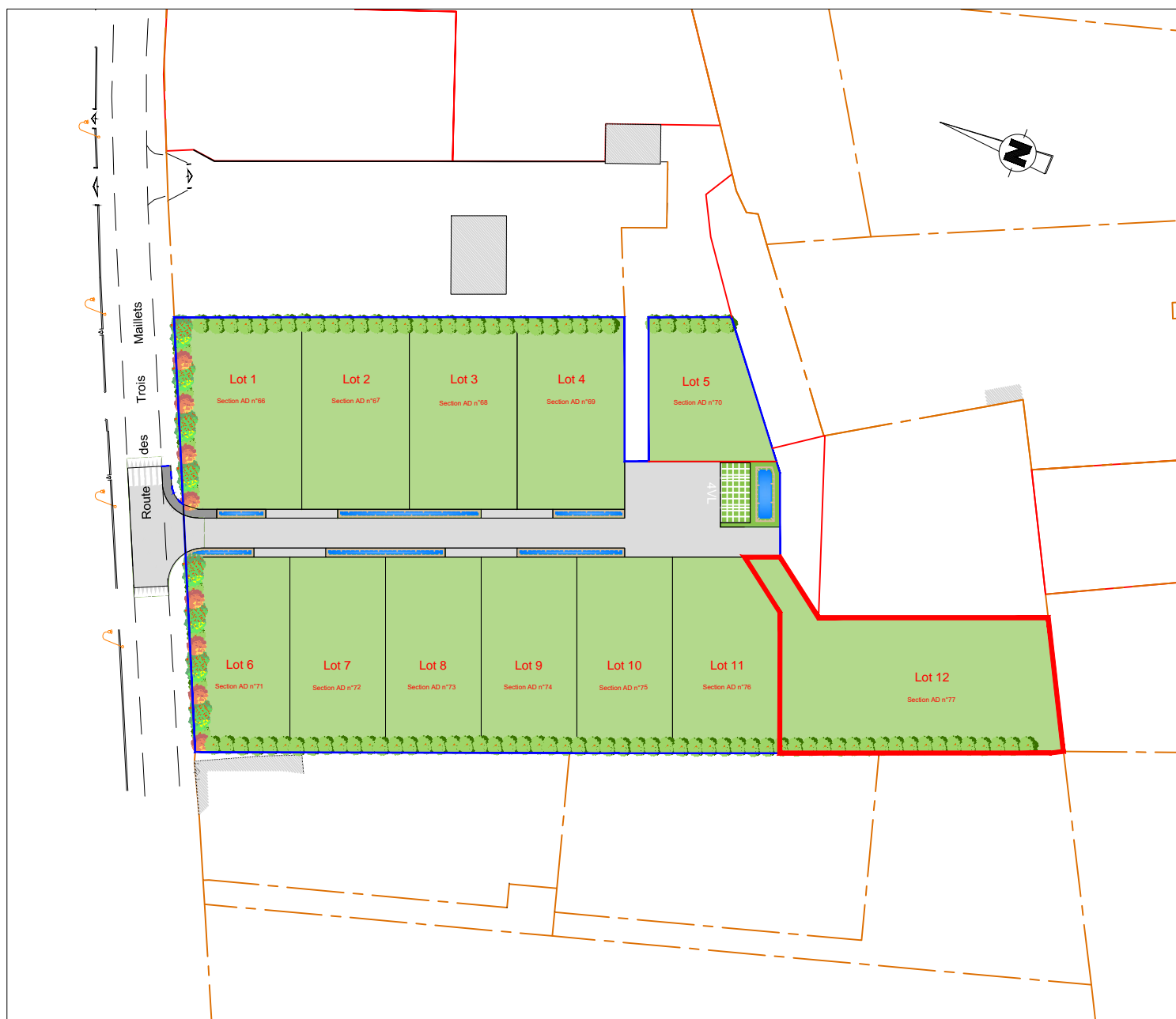
PLAN DE COMPOSITION Echelle 1/1000

Département de La SARTHE Commune de Saint-Ouen-en-Belin "Le Petit Pré"